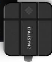
USB C or HDMI/USB ZENDER