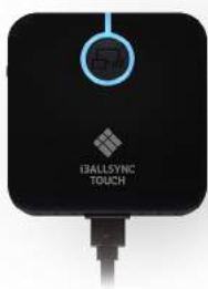
USB C ZENDER

Op i3TOUCH-panelen is de i3ALLSYNC-software ingebouwd, dus je hebt geen ontvanger nodig.